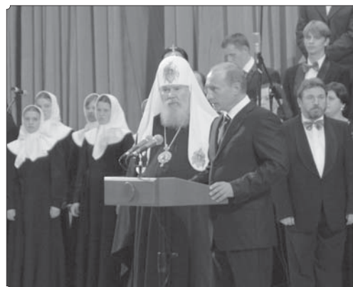
Президент РФ В.В. Путин поздравляет Его Святейшество с 45-летием архиерейской хиротонии.

Перед началом концерта духовных песнопений собравшимся был продемонстрирован фотофильм «Преемник Первосвятителей Российских», выпущенный специально к патриаршему юбилею. В заключении Его Святейшество обратился к присутствовавшим с Первосвятительским словом. Отметив, что в этот день отмечается вторая годовщина бесланской трагедии, Святейший Патриарх призвал всех присутствующих почтить память жертв теракта: всем невинно убиенным в Беслане была возглашена «Вечная память».