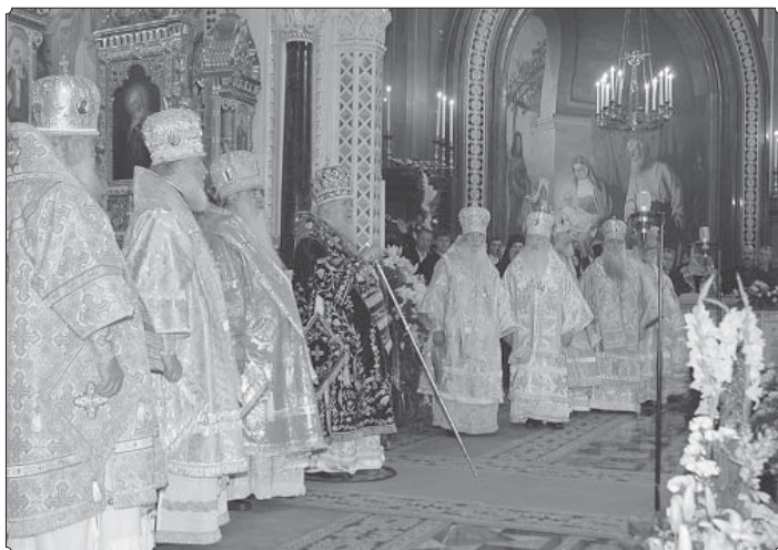
Храм Христа Спасителя. Москва, 3 сентября 2006 года

3 сентября 2006 года в Москве состоялись торжества по случаю 45-летия архиерейской хиротонии Святейшего Патриарха Московского и всея Руси Алексия II. В юбилейных торжествах принял участие Митрополит Минский и Слуцкий Филарет, Патриарший Экзарх всея Беларуси.